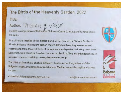
Етикет на гърба на една от 30-те мозайки.