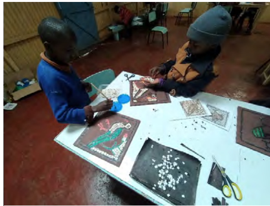
Изработка на мозайки от хартия.