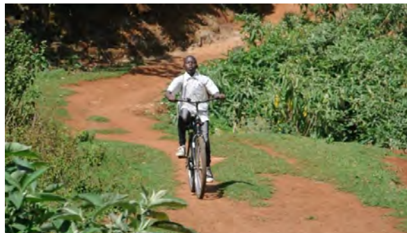
Сцени от филма „Кой е твоя ближен?“