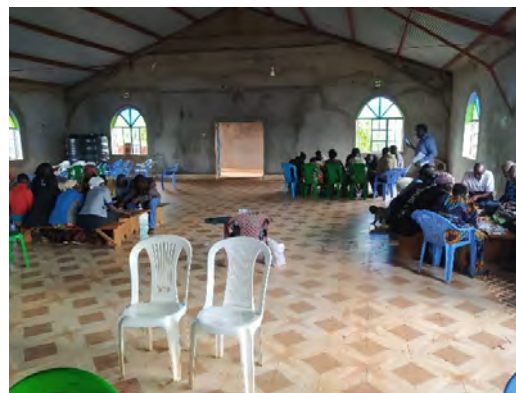
Уъркшоп до планината Елгон.