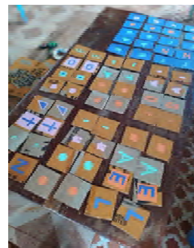
Мемори карти изработени от участниците.

В района на Бунгома, отново в сътрудничество с ICFeM са проведени още 4 учителски семинара – Маени, планината Елгон, Чаптайс и в град Кимилили. Общият брой на обучените учители е 250.