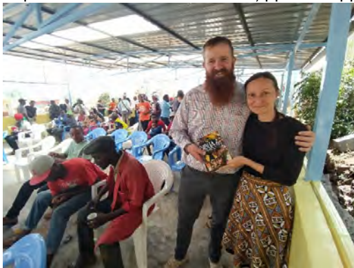
По случай празника, подарихме комикс Библия.

Гетата в Кения са много често срещани навсякъде. Бедността притиска голяма част от семействата и често децата, обикновено момчета, се оказват на улицата. Липсата на средства за училищни такси, суровите и тежки условия на живот често оставят подрастващите и младите без никаква надежда. Живеещите на такива места имат пълното право да мислят, че са забравени от всеки. Нуждите им са огромни. И на точно такова място, мисионерите към Фондацията, бяха поканени от други мисионери да участват в откриването на център за нуждаещи се, които живеят на улицата. Млади момчета, момичета, жени с деца са добре дошли да се изкъпят, изперат дрехите си и да имат добра другарска компания за разговори, където да се почувстват приети и обичани. Мястото е съвсем семпло, но оцветено в синьо и жълто, дава надежда.