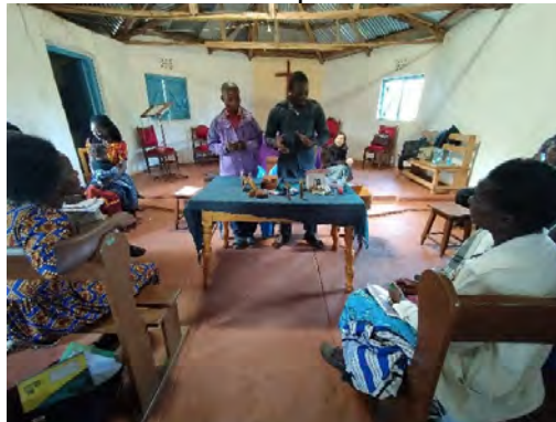
Нагледен урок в Маени.

ICFeM има за цел да изгражда хората, приоритетно в селските райони, както духовно, така и практически, за да бъдат способни да се самоиздържат. Организацията поддържа училище и болница в град Кимилили.