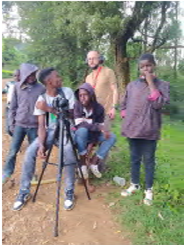
Част от продукционния екип.

Филмът не е завършен и работата по този проект продължава.