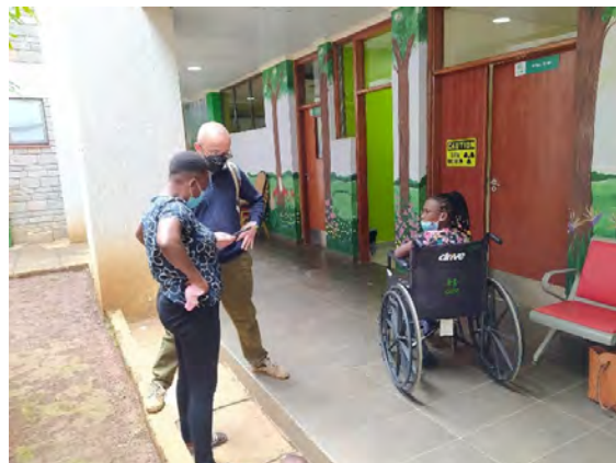
В болницата Кюър, гр. Киджабе, Кения.