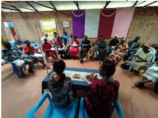
Обучение за учители в Кимилили.

Семинари за детски работници и неделни учители – през месец февруари 2022 г. Фондация „Мисия Африка“ в сътрудничество с Kahawa Media, Кения и ICFeM проведе учителски семинари в районите на Намуела и Чапкубе. ICFeM е регистрирано дружество в Кения. Това е местна кенийска организация, базирана в Кимилили, Западна Кения, чиято мисия е плавно интегриране на развитието на общността и иновативното предоставяне на холистични грижи.