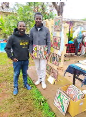
Елайша продава първата мозайка.