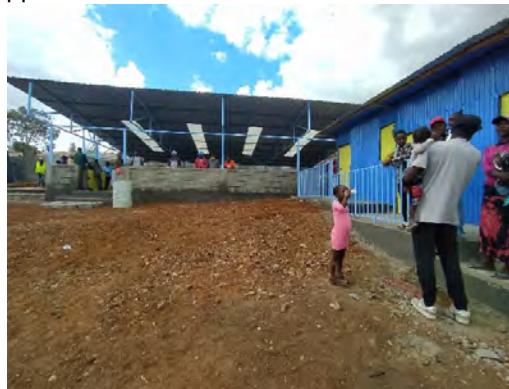
Дворът на новия център в Гитурай, гр. Найроби.